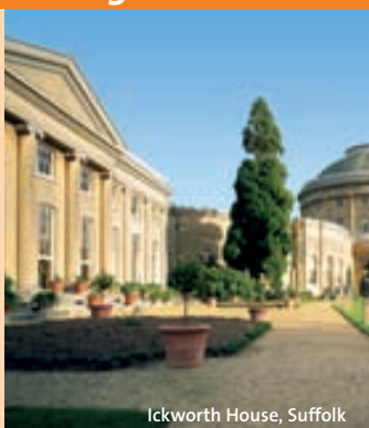
Ickworth House, Suffolk

Der National Trust, die britische Institution für Naturschutz und Denkmalpflege, bietet Ihnen mit diesem Pass freien Eintritt in über 400 unter Natur- und Denkmalschutz stehende Schlösser, Gärten und weitere Anlagen in ganz England, Wales und Nordirland wie z.B. Buckland Abbey in Devon oder Ickworth House, in Suffolk. Der Pass ist erhältlich für 7 oder 14 Tage und seine Gültigkeit beginnt mit Ihrem ersten Besuch in einer der Anlagen.