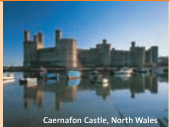
Caernarfon Castle, North Wales

Entdecken Sie Wales von seiner schönsten Seite. Mit dem Wales Explorer Pass haben Sie freien Eintritt zu den vielen Sehenswürdigkeiten die das kulturelle Erbe von Wales ausmachen. Caernarfon Castle, Tintern Abbey und Brecon Gaer Roman Fort sind nur einige wenige der unzähligen Sehenswürdigkeiten. Das Ticket ist für 3 und 7 Tage erhältlich.