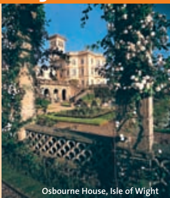
Osbourne House, Isle of Wight

Mit diesem einmaligen Ticket sparen Sie sich die Eintrittsgelder zu zahlreichen staatlichen und privaten Sehenswürdigkeiten in England, Schottland, Wales und Nordirland. Über 500 herrschaftliche und geschichtsträchtige Bauwerke wie z.B. Edinburgh Castle, Windsor Castle, Stonehenge oder die St Paul's Cathedral in London warten nur auf Ihren Besuch. Erhältlich ist der Pass für 4, 7, 15 und 30 Tage.