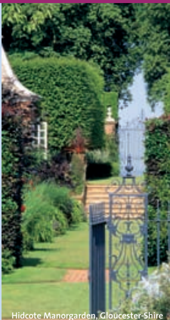
Hidcote Manorgarden, Gloucester-Shire