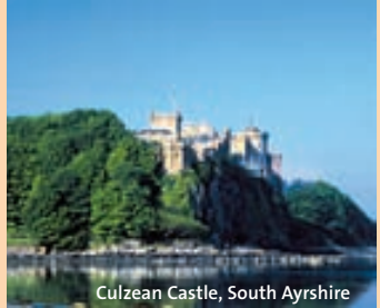
Culzean Castle, South Ayrshire

Erleben Sie einen unvergleichlichen Aufenthalt in Schottland und besuchen Sie mit dem Discovery Ticket so viele interessante Plätze wie möglich. Sie haben freien Eintritt zu Schlössern, wunderbaren Gärten und historischen Schlachtfeldern wie z.B. Culzean Castle oder Inverewe Garden. Das Ticket ist für 3, 7 und 14 Tage erhältlich, wobei das 3 Tages-Ticket nicht an 3 aufeinanderfolgenden Tagen benutzt werden muss.